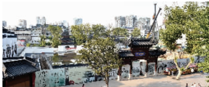
科举博物馆北苑的施工现场