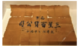
三星百货公司油皮包装纸