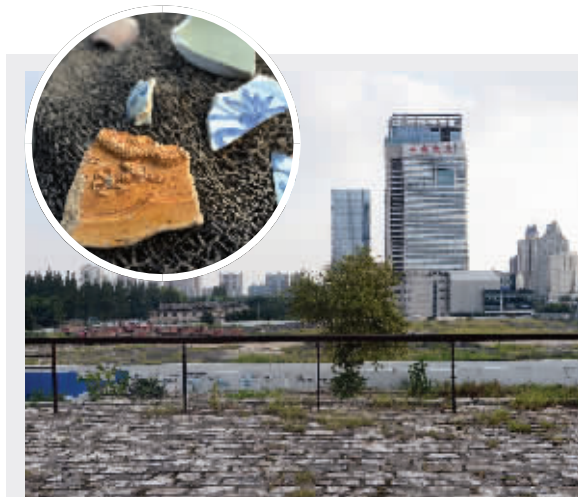
从西安门上拍摄的中航科技城的项目;工地上有不少黄色的琉璃瓦(小图)