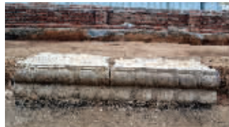
明代皇城西墙包边石墙