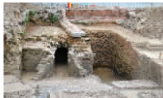
明代涵洞及砖砌水池