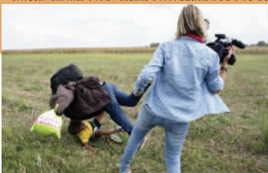
女记者的脚还没收回来,孩子已跌倒在父亲身下