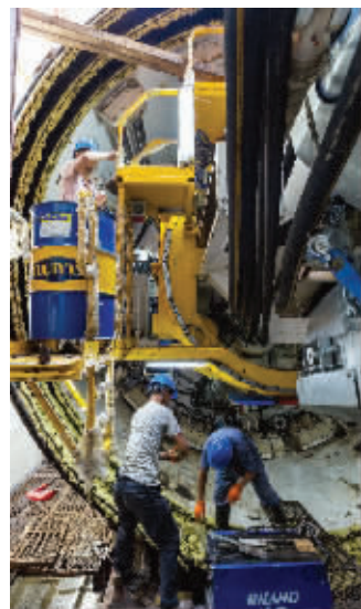
工人在安装调试盾构机

预计周末两天天气有所下滑,最高温只有26℃左右,秋天的脚步越来越近,凉席等夏季用品也可以陆续收起来了,晚上睡觉时也要注