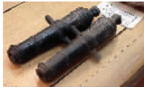
太平军使用的大炮复制品

在临时展厅中, 有两个复制的太平天国大炮, 而在将来的展览中, 会展出实打实的太平天国大炮, 不仅展出太平军的大炮, 还会展出当时清军的大炮、外国的洋炮。