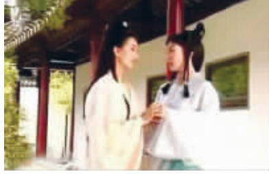
《新白娘子传奇》剧照, 该片曾在瞻园取景