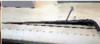
太平军使用的火枪