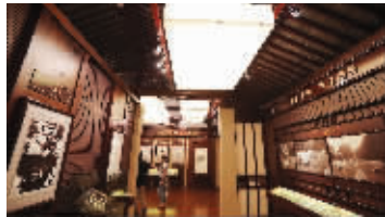
展厅使用的吊灯、展板将被拆除

在600年历史中, 不得不说太平天国这段历史。有人说, 1853年, 太平军一进城, 东王杨秀清就把它改装成“东王府”, 把一座旧园子整得比天王府还五星……1856年9月1日深夜, 韦昌辉包围东王府, 把睡梦中的杨秀清杀死, 而后血洗东王府, 一把火烧了整座府邸。“其实, 杨秀清不是死在这里的。这里确实做过东王府, 但是时间不长。”吴瞻澄清说, 当年, 杨秀清被杀死的时候, 已经搬离了这里, 天京事变时期的东王府其实在汉西门的黄泥岗, 也就是今天的汉中路北侧, 在南京医科大学附近。