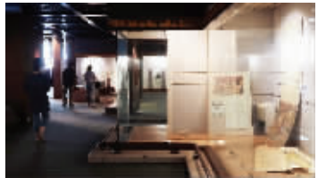
临时展厅正在布展