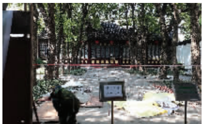
江宁布政使司署正在围挡修缮