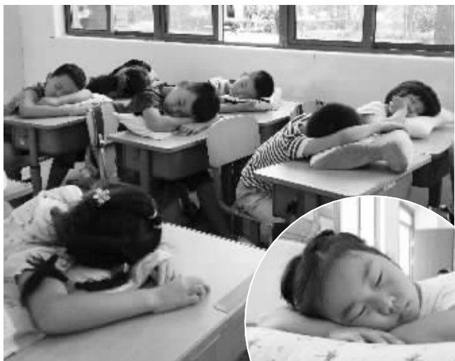
南京市将军山小学要求新生带枕头,让孩子们睡得更舒服