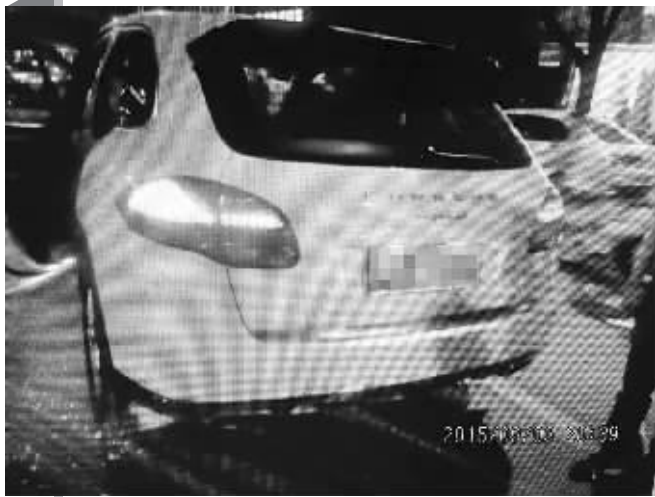
被撞的保时捷