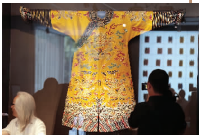
“清乾隆龙袍”也大出风头

据悉,这幅作品从设计、挑花到织造,40人的团队历时半年时间完成。一亮相米兰世博会南京周,就惊艳全场,不少当地的艺术家、学者前来参观,赞不绝口,预估这幅作品可达100万欧元。