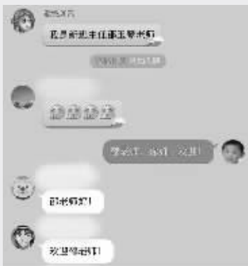
前一天,她还在网上跟家长们打招呼