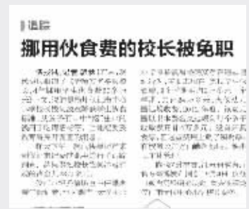
现代快报报道次日,涉事校长被免职