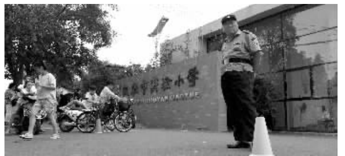
邵玉琴就是在这所学校内坠楼身亡的