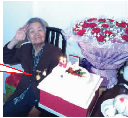
戴上纪念章,老人敬了个军礼