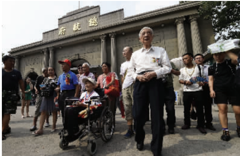
老兵们来到总统府游览