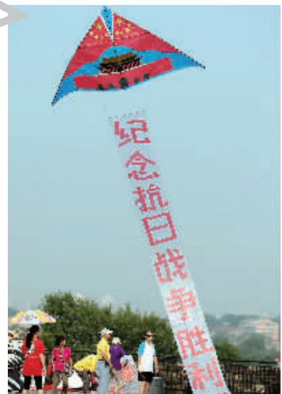
老兵放风筝纪念抗战胜利70周年

昨天,12位南京老兵齐聚中华门瓮城城墙上,一起放飞纪念抗战胜利70周年主题风筝,提醒国人铭记历史,珍爱和平。其中抗战老兵车阿坤制作的纪念抗战胜利70周年主题风筝特别惹人。