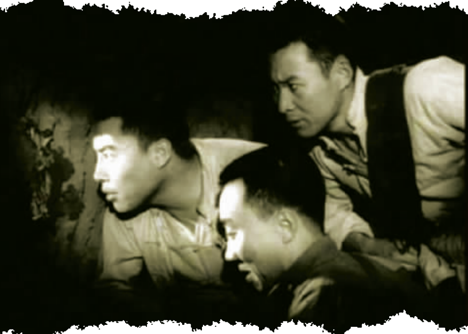
《地道战》是观众心中经典