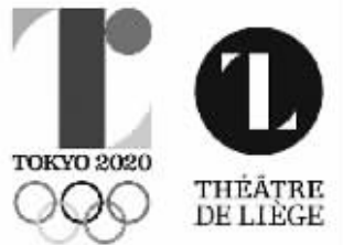
涉嫌剽窃的“会徽”(左)

东京奥运会会徽涉嫌剽窃一事1日出现剧情逆转,东京奥组委一改先前力挺会徽设计者佐野研二郎的态度,决定抛弃这个会徽设计。日本共同社、日本广播协会、东京广播公司等多家媒体报道此事,并把过去一个月描述为东京奥组委的“尴尬月”。