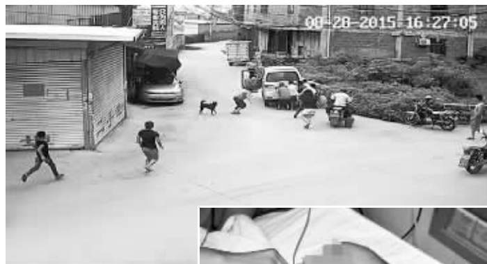
村民从四面八方赶来救人

8月31日记者了解到,这一幕发生在福建省晋江市店镇梧潭村路口,母子二人经检查无生命危险。