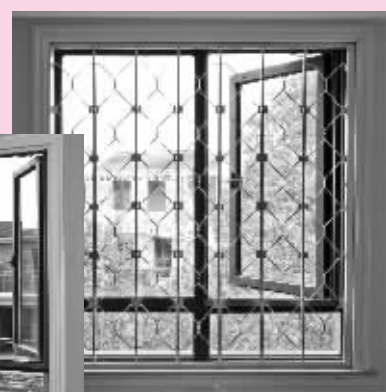
▲ 防盗窗的室内拍摄图