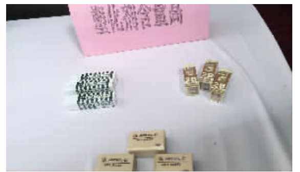
江苏省质监局公布的部分不合格文具产品, 其中包括晨光“孔庙祈福”橡皮擦