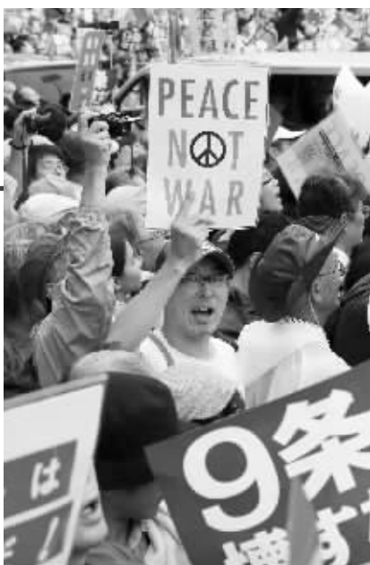
人们手举标语反安保法案