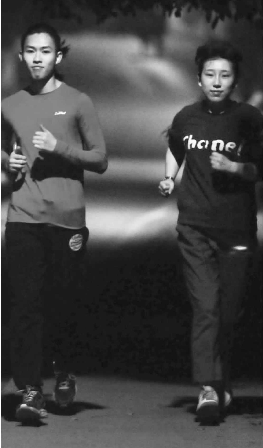
租个教练陪跑是城市里的流行玩法