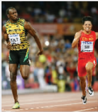
苏炳添让博尔特刮目相看

昨天在接受记者专访时,苏炳添说:“下一个目标就是在明年的里约奥运会上实现突破。如果既突破9秒99,又闯进决赛,那就太高兴啦!”