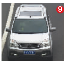
豫SV5888 灰色尼桑 经常行驶区域:无锡、张家港 对应真实车辆:灰色东风牌