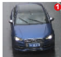
沪A5B588 蓝色奥迪 经常行驶区域:苏州 对应真实车辆:黑色雅阁

省公安厅交警总队负责人表示,目前,江苏正在全力缉查9辆公安部交管局督办的假牌、套牌车。市民如果发现,请及时向110或96122进行举报。