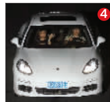
浙CZ8Y55 白色保时捷 经常行驶区域:苏州、连云港 对应真实车辆:白色现代