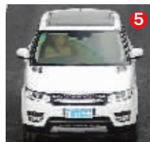
浙F619G5 白色路虎 经常行驶区域:苏州、扬州 对应真实车辆:黑色东风日产