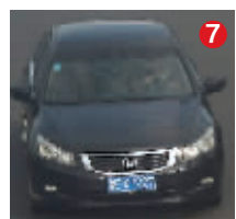
鲁EX7227 黑色本田 经常行驶区域:连云港、灌云 对应真实车辆:棕色索兰托