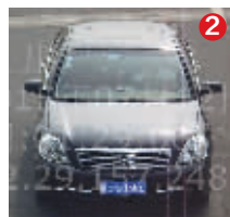
苏E6J3E6 黑色尼桑 经常行驶区域:苏州、泰州 对应真实车辆:银灰起亚