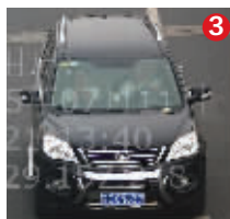
苏ECN637 黑色长城 经常行驶区域:泰州 对应真实车辆:灰色丰田