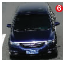
皖A83949 本田汽车 经常行驶区域:南通 对应真实车辆:绿灰桑塔纳