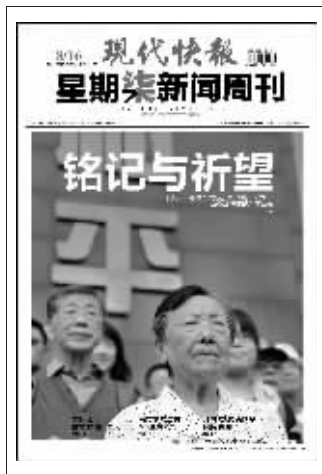
(上周星期柒新闻周刊封面)