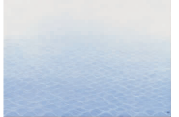
《对话马远之秋水回波》