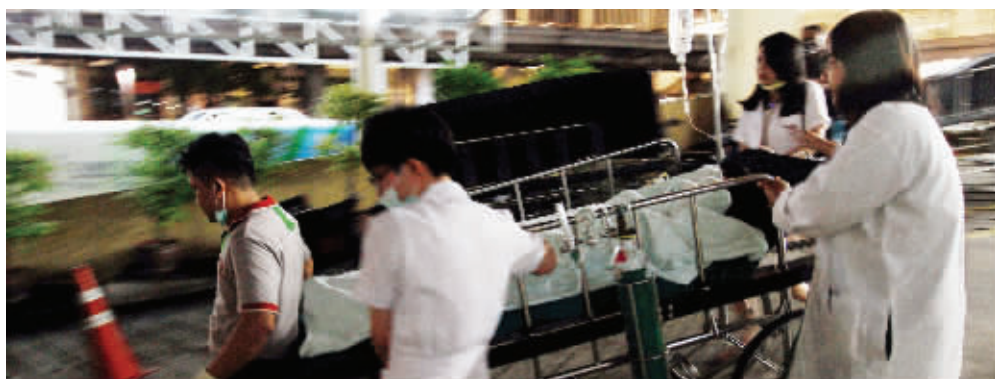
8月17日晚,医护人员护送爆炸事件受伤者前往附近医院

可才第二天,新闻中就播出了曼谷发生爆炸的事。“我从电视里看到这件事了,之前没想到,他们会遇上……”