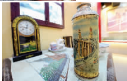
印有大桥画像的老物件