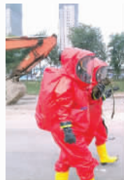
南通消防队员进入爆炸核心区