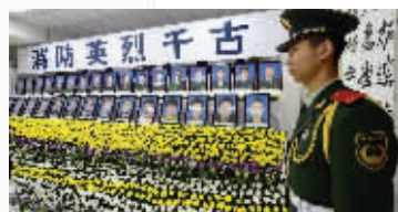
一名消防战士站在消防英烈的照片前