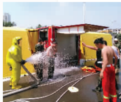
南京消防队员正在对救援人员、设备进行洗消