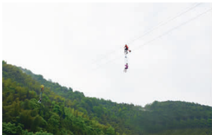
宁乡龙泉大峡谷的高空自行车项目,操作方式为一人在上操纵自行车,带动另一搭乘在座椅上的人前进