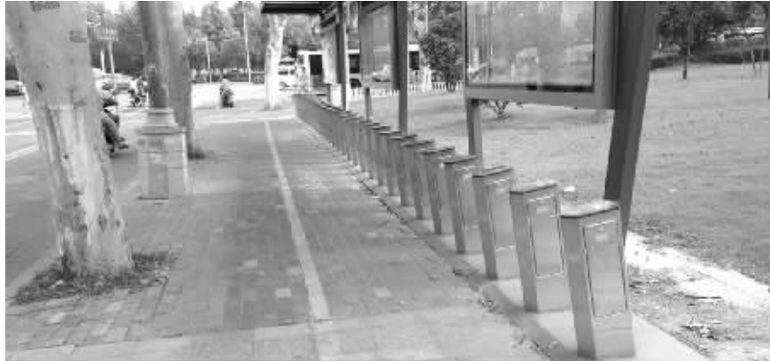
桥北客运站南网点,一辆公共自行车都没有 网友供图,请来领稿费

随着南京地铁线路的增多,公共自行车作为解决最后一公里出行的首选交通工具,受到市民青睐。然而,最近有市民发现,桥北部分公共自行车网点有的无车可借,有的无位可还,给出行造成很大不便。江北绿航公共自行车公司相关负责人表示,确实有网点因调度车无法驶入,补充车辆较难,已让工作人员不定时人工补充。 现代快报记者 刘伟伟 陈志佳