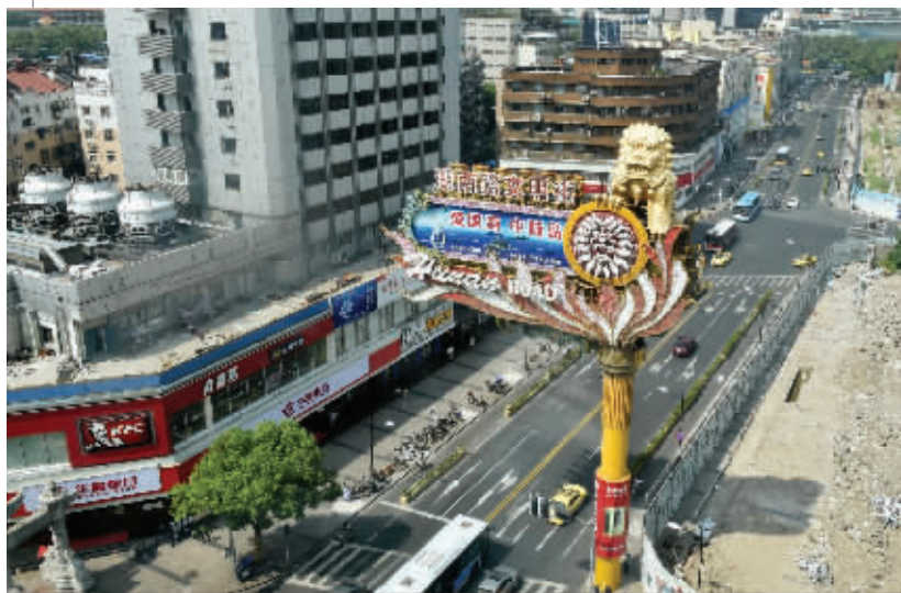
预计最快国庆节后,湖南路路面将全面封闭施工