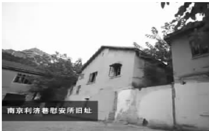
南京利济巷慰安所旧址 本版均为视频截图