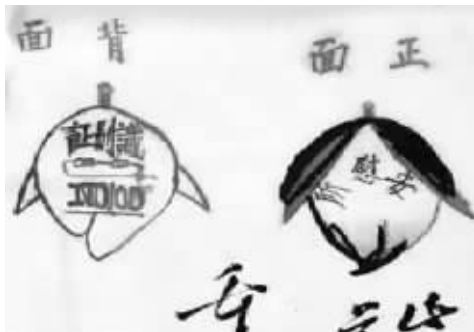
慰安所备用识别章首次亮相

世界舆论和国际机构早已对“慰安妇”制度做了谴责,有了定论。2014年,联合国人权理事会发表《日本人权审查结论》报告,认为日本应该为二战期间的“慰安妇”问题承担责任。