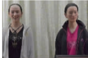
章子怡(左)和巩俐的蜡像

明星蜡像最大的看点就是以假乱真,不过最近“华蓁山中名人蜡像馆”被网友热议并不是因为馆中的蜡像太像明星,而是因其“丑到没朋友”。