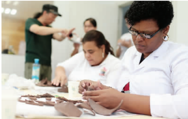
非洲学员尝试修复紫砂花瓶