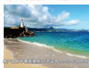
本产品由中青旅提供 许可证书:L-JS-CJ00018