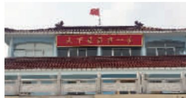
有“天下第一庄”美誉的句容丁庄