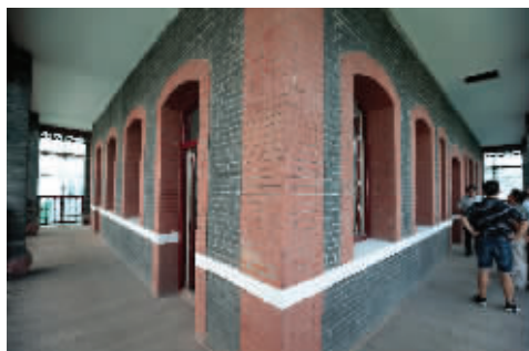
“小姐楼”的外部走廊