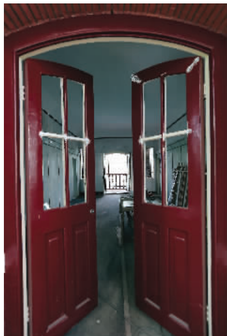
“小姐楼”的内部还在装修中