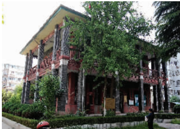
2010年5月,修缮前的“小姐楼”