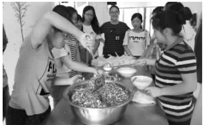
南审支教大学生在包饺子

快报讯(通讯员 费辉 唐利 记者 俞月花)条件艰苦,大家就动手包韭菜粉丝鸡蛋馅饺子来改善伙食,日前,南京审计学院的暑期支教小分队来到安徽定远县张桥中心小学为那里的孩子们带去关怀。由于当地生活条件困难,这些支教的大学生也从生活中学会了“生存本领”。