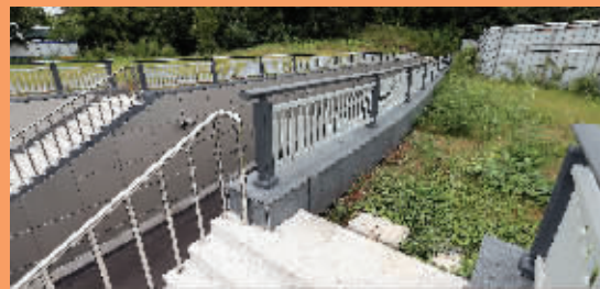
地下通道白马公园一侧的出口被堵死