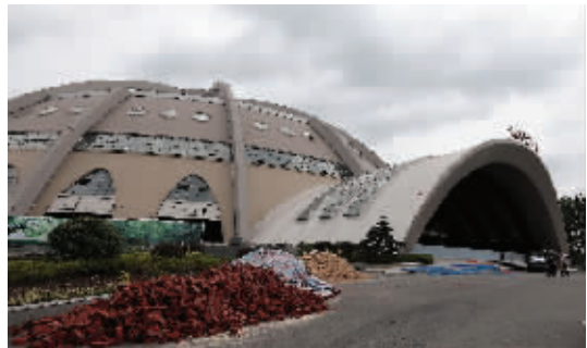
太阳宫正在进行二期改造