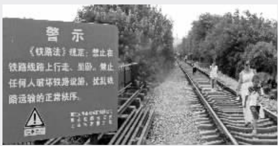
铁道沿线设有警示标牌