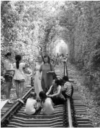
市民参观“爱情隧道”