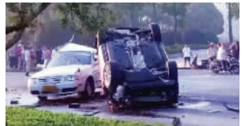
事故现场一片狼藉 网络图片(请作者来领稿费)