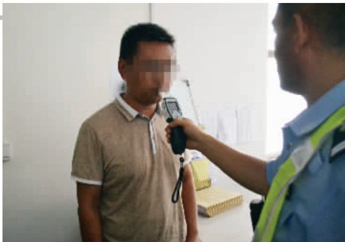
双沟中心小学副校长房某接受警方酒精检测