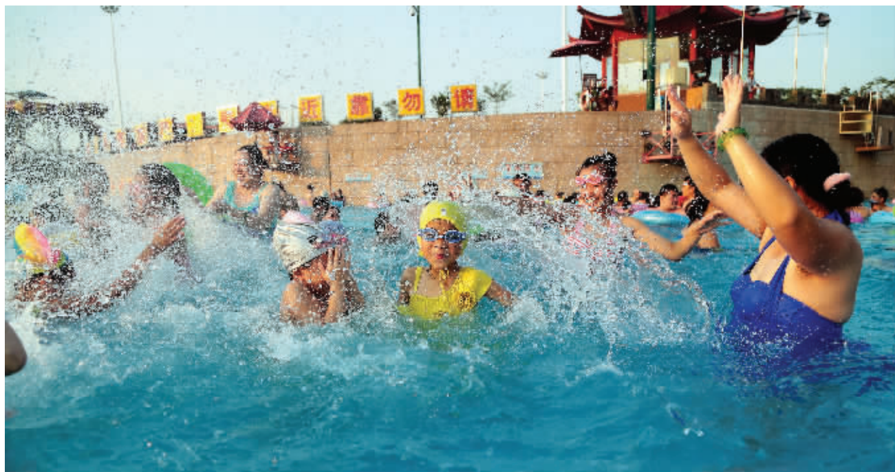
昨天,很多家长带着孩子在欢乐水魔方水上游乐场的泳池里嬉戏玩耍