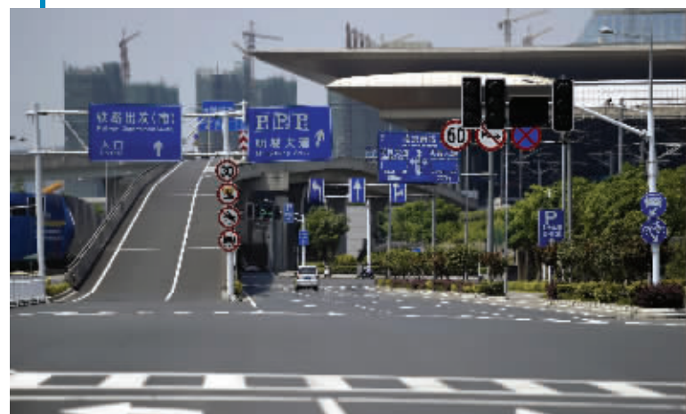
到了金阳东街才能看到南京南站南广场的指示牌