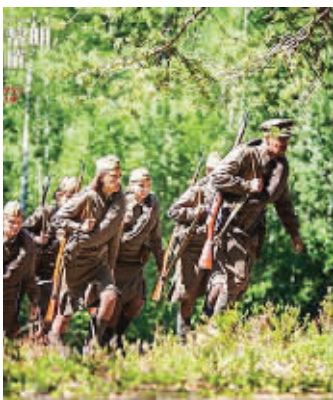
《这里的黎明静悄悄》剧照