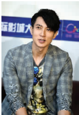
吴尊昨天现身南京