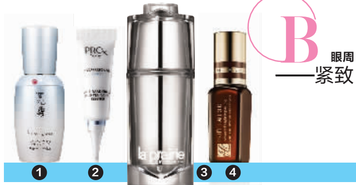
1.雪花秀水律莹润提拉眼部精华露;2.Pro-X博研诗纯白方程式淡化黑眼圈亮眼精华乳;3.La Prairie臻爱铂金眼部精华;4.雅诗兰黛即时修护眼部密集精华露

不可否认,我们心中所感所想,就在我们的一颦一笑之中……娇嫩眼眸尤其如此,纤薄于面部其他区域,日益堪忧的环境污染,眨眼、微笑、蹙眉等每天高达上万次的频繁运动,都会引发多重眼周肌肤问题。除此之外,随着我们年龄的增长,诸如胶原蛋白这样的细胞外基质成分也在逐渐流失,肌肤随之慢慢失去弹性,