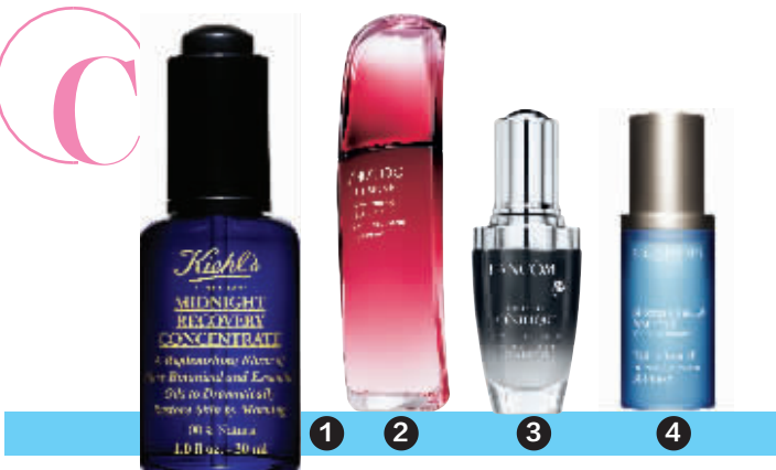
1.Kiehl's夜间修护精华液;2.SHISEIDO红妍肌活精华;3.LANCOME小黑瓶精华肌底液;4.娇韵诗恒润奇肌保湿精华液

脸颊恢复水润Q弹。 SHISEIDO红妍肌活精华由资生堂联合哈佛医学CBRC中心共同投入研究免疫学20余年,这款产品中就含有全球31项专利,独家ULTIMUNE复方成分能激活朗格汉斯细胞免疫网作用,诞生源源不断由内而外战胜岁月、压力及外界损伤的强韧美丽能量。