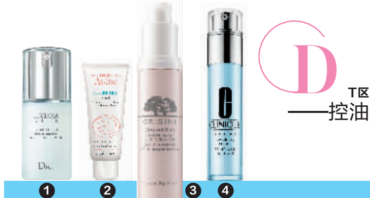
1.Dior迪奥水动力精萃青春精华液;2.雅漾控油细致毛孔调理露;3.Origins悦木之源粉滑嫩精华素;4.倩碧宛若新生精华露

T区应该是妹子们最爱出油的部位,何况到了夏天这种状况会更加严重,想要清爽度夏可以选择使用控油的精华产品。控制T区的出油状况,可以选择质地清爽均衡的精华。使用时,注意在易出油、毛孔粗大的T区部位稍作按摩,成分的选择上,金缕梅、金盏花、水杨酸、茶树精华等都是控油产品中经常