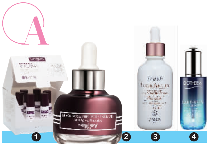
1.巴黎珂蒂丝精华赋颜密集型紧致提升精华素;2.SISLEY黑玫瑰珍宠滋养精华油;3.Fresh古源修护抗皱精华油;4.碧欧泉蓝源精华露

彩紧致面膜推出黑玫瑰珍宠滋养精华油,融合创新成果:山茶籽油(富含Omega3和Omega6)、浓郁的玫瑰精油的香气具有让人的精神呈现最舒适状态的作用,从而让人体生理及心理获得愉悦的体验,让护肤变成一种享受。秉承品牌一贯“安全、有效、愉悦”的奢护理念,配方中更添加5种植物活性成分,功效协同加乘,强化肌肤天然保湿防护屏障,抗老修护,重现新生光彩。多重精油散发满溢芬芳,每一次使用都唤醒感官愉悦享受。