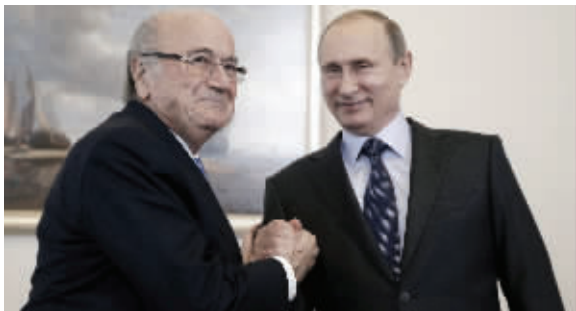
普京(右)和布拉特的握手方式,并非中规中矩的政治家之间的握手,而是情同兄弟般紧紧相握

抽签仪式上,电视台主持人舍佩莱夫和超模沃佳诺娃担任司仪。俄罗斯总统普京与布拉特同时入场,这是布拉特在国际足联陷入“反腐风暴”后首次公开亮相。