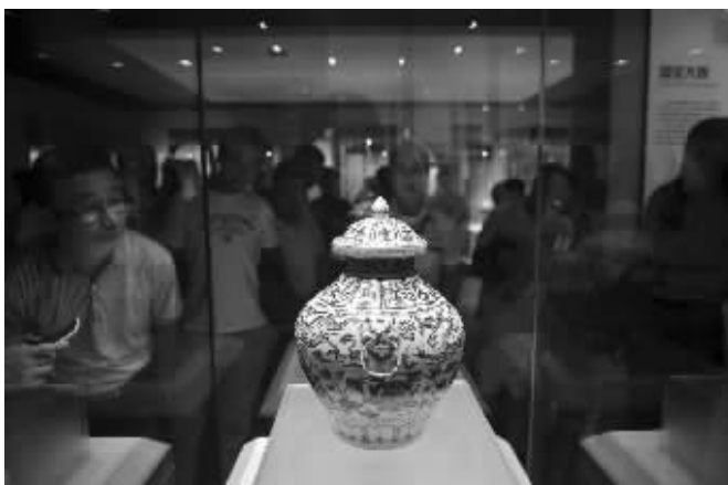
元代青花云龙纹兽耳盖罐,这是19件元青花中尺寸最大的一件

县委、县政府认为,在家福乐购物中心二店火灾事故原因正在调查期间,县非公企业党委组织这样的捐款活动是不妥当的。因此,县委、县政府已责成县非公企业党委收回该文件,停止捐款活动。说明中也指出,关于火灾事故原因,省、市消防部门正在做深入调查。 综合