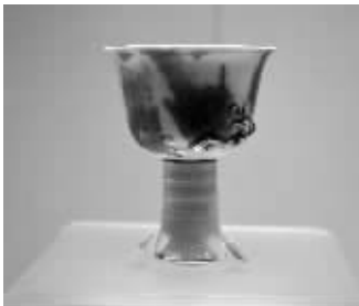
釉里红堆塑蟠龙彩斑高足转杯