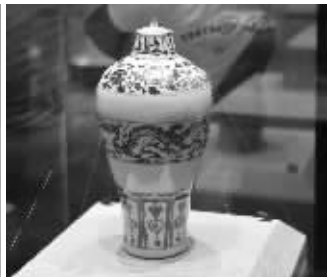
青花云龙纹带盖梅瓶