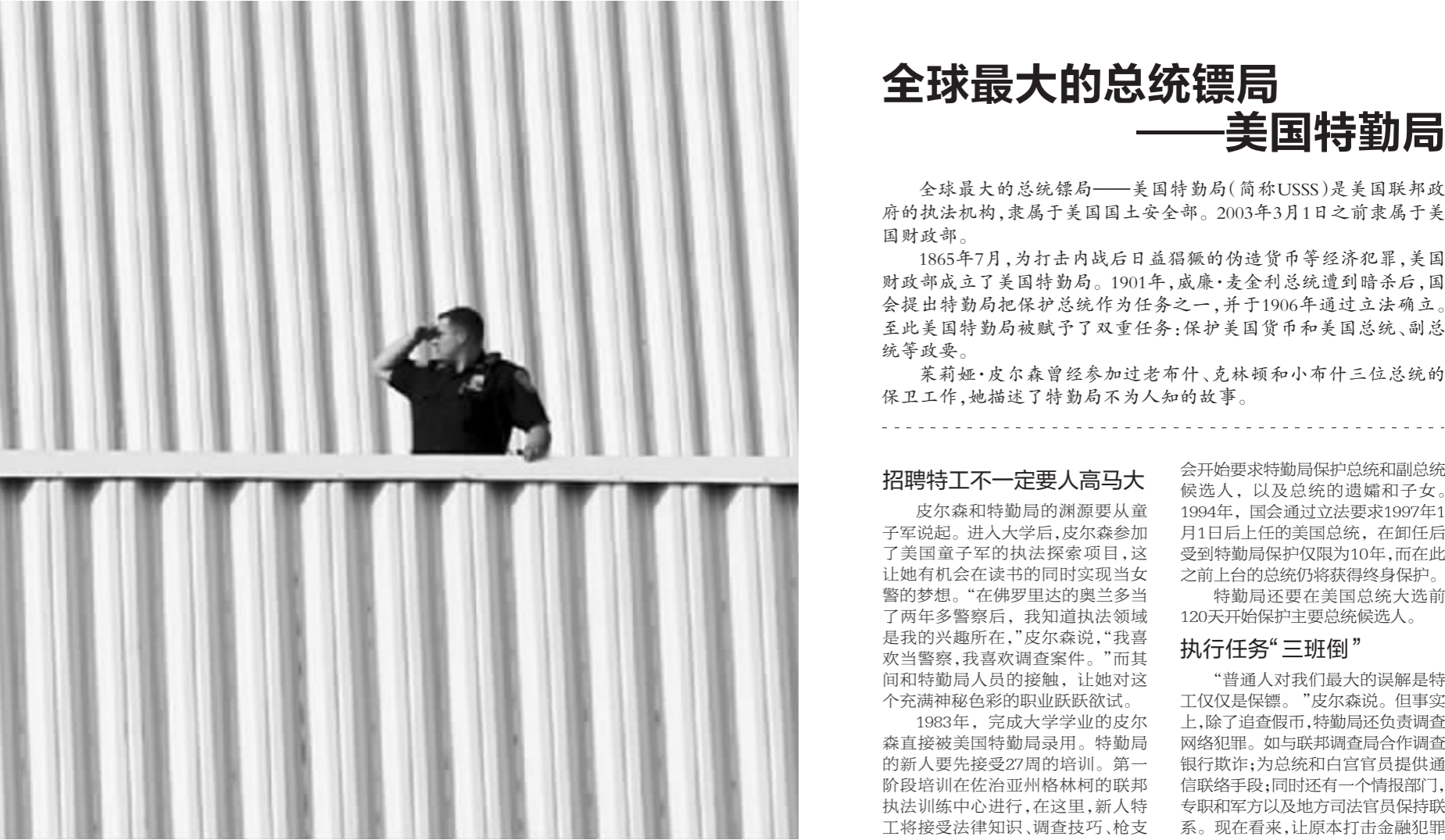
“网络威胁工作组”的特工就像一群瞭望者，随时瞭望着网上的危险信息，确保美国总统及其家人的安全

根据特勤局近年来追查的一些案例，他们基本上能够找出一些线索去判断哪一类的威胁情况比较严