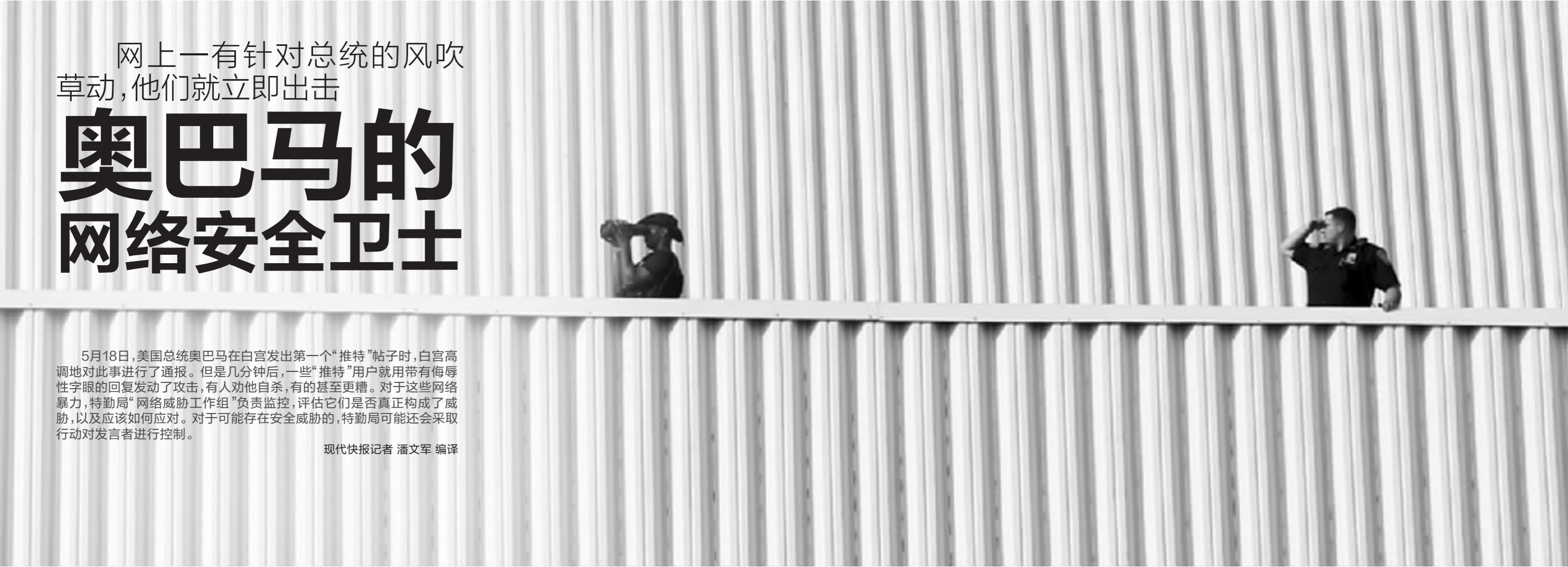
“网络威胁工作组”的特工就像一群瞭望者，随时瞭望着网上的危险信息，确保美国总统及其家人的安全