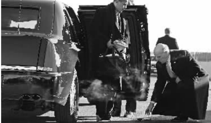
当地时间2009年1月16日，美国阿灵顿罗纳德·里根国际机场，一名美国特勤局特工(右)弯腰捡起总统奥巴马掉落的手机