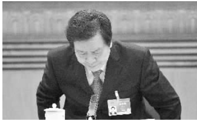
2015年3月9日，周本顺参加十二届全国人大三次会议

河北省委书记、省人大常委会主任周本顺涉嫌严重违法违纪，目前正接受组织调查。据了解，周本顺是十八大后第一个被查的现任省委书记，第5名落马的十八届中央委员。综合中央纪委监察部网站 人民日报客户端