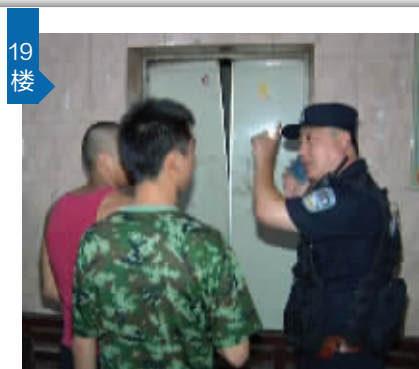
19楼 后来搜救人员发现两人在19楼电梯中