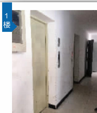
1楼 祖孙俩乘电梯到一楼时被困

7月20日下午4点半左右, 家住南京市秦淮区科巷新寓的陈奶奶带着小孙女下楼。她们从13楼乘电梯到一楼后, 却发现电梯门无法正常打开。听见电梯内小孙女的哭声, 居民们把电梯门扒开一道缝, 希望祖孙俩能喘口气。半小时后, 消防武警和特警以及维修电梯的工作人员赶到, 经过差不多两个小时的努力, 工作人员终于在19楼将电梯门打开, 祖孙俩最终走出电梯。而有心脏病史的陈奶奶立刻被120急救车送至医院, 目前陈奶奶仍在住院, 病情比较稳定。 通讯员 张艳 王艳 现代快报记者 郝多 赵书伶 见习记者 刘静妍/文 (爆料人线索费50元)