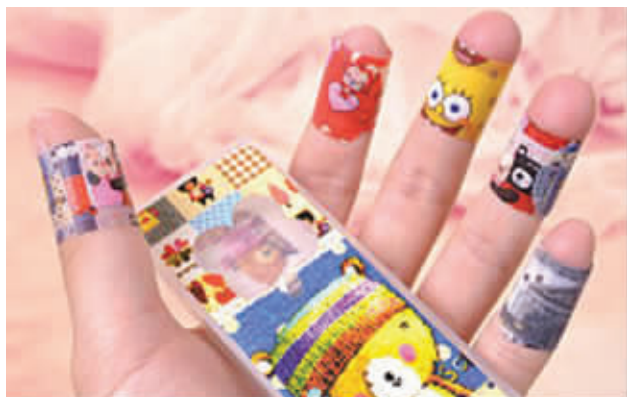
卡通创可贴颜值虽高,但存安全隐患