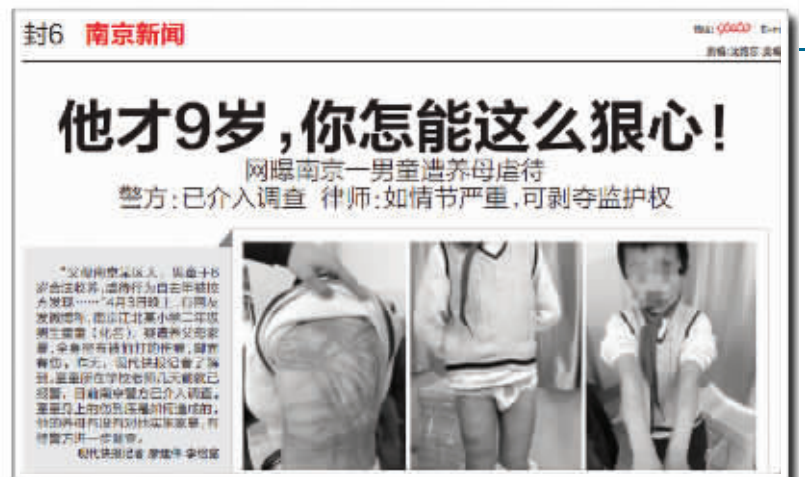
4月5日,现代快报曾作报道

7月6日,检察机关延长审查起诉期间15日,至2015年7月20日第二次审查起诉期间届满。