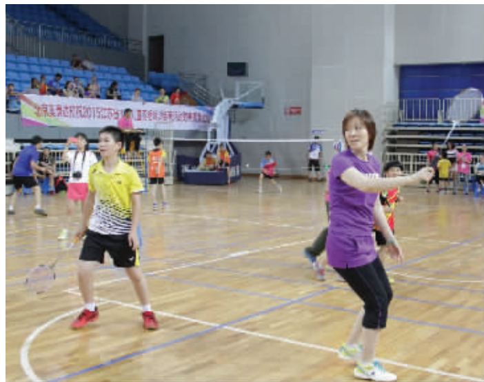
奥运冠军葛菲披挂上阵

2015江苏少年儿童羽毛球训练营进行了创新变革。首先, 在模式上, 打破了传统的成绩排名模式, 体现了鼓励参与、快乐体验、寓教于乐、强调互动等特征; 其