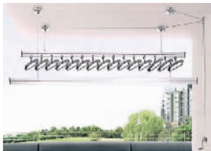
▲ 德国麦德琪高档手摇晾衣架 (室内安装) 产品型号: MDQ-5801

超值优惠 280 元 / 原价 480 元 ★ 赠送价值 88 元豪华伸缩衣撑礼盒