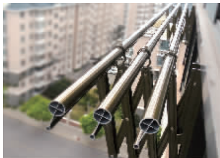
▲ 德国麦德琪高档推拉晾衣架 (户外安装) 产品型号: MDQ-163

超值优惠 280 元 / 原价 480 元 ★ 赠送价值 88 元豪华伸缩衣撑礼盒