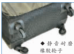
◆静音耐磨橡胶轮子