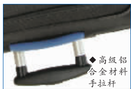
◆高级铝合金材料手拉杆