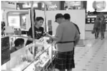
▲图为7月15日拍摄的刘蝶广场内部场景,一家商铺正在接待顾客