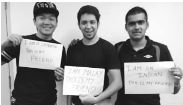
▲图为一名马来西亚网民在社交网站上发布照片,呼吁民众团结

目前,马来西亚政府、王室成员、警方等均已出面驳斥,称事件无关种族,呼吁民众保持冷静。记者进一步调查发现,事实上,这原本是一起简单的犯罪案件,经网络不实传言引发了小规模群体事件,马来西亚政府已经采取措施予以控制,所谓针对华人的大规模种族暴力事件并不存在。